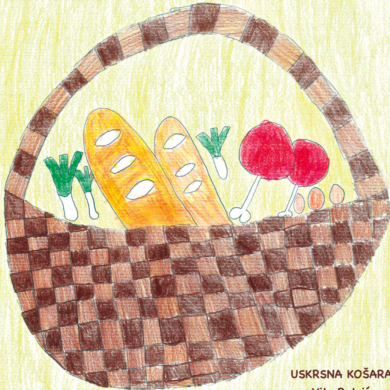
USKRSNA KOŠARA Vita Rataić